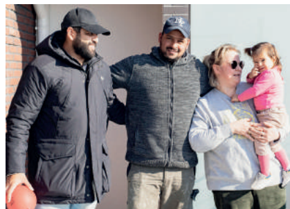
Nouveaux locataires de Fort de l'Est

Le 8 mars, l'Office livrait sa première résidence sur le terrain du Fort de l'Est à Saint-Denis. Ancienne caserne militaire, le fort abrite désormais un quartier résidentiel aux portes des villes de Saint-Denis, La Courneuve et Aubervilliers. Les 73 logements de la résidence répartis en 3 bâtiments organisés autour d'un jardin partagé. Ce programme immobilier participe notamment au relogement des locataires d'opérations de renouvellement urbain, dont la cité du Franc-Moisin, et surtout à la transformation du quartier.