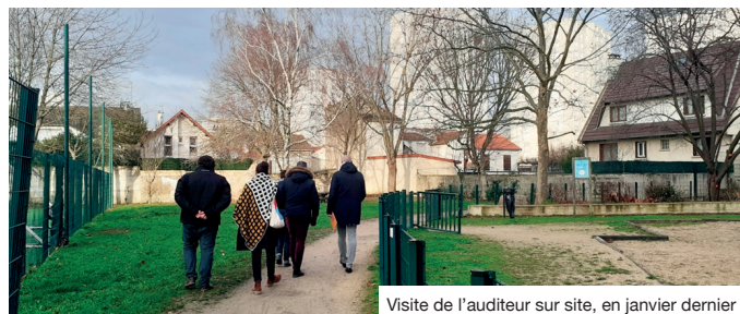
Visite de l'auditeur sur site, en janvier dernier