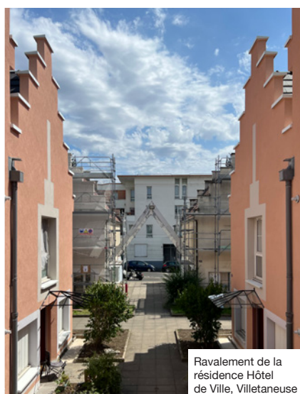
Ravalement de la résidence Hôtel de Ville, Villetaneuse