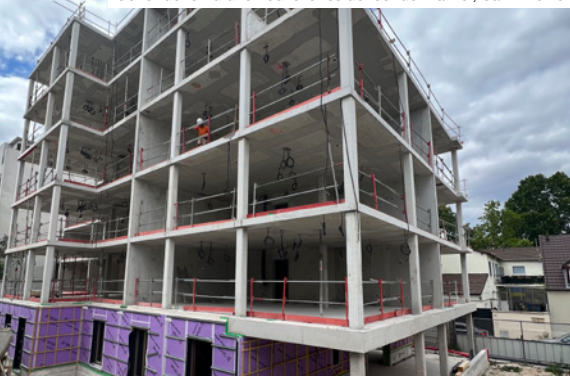
Construction d'une nouvelle résidence rue Fraizier, Saint-Denis