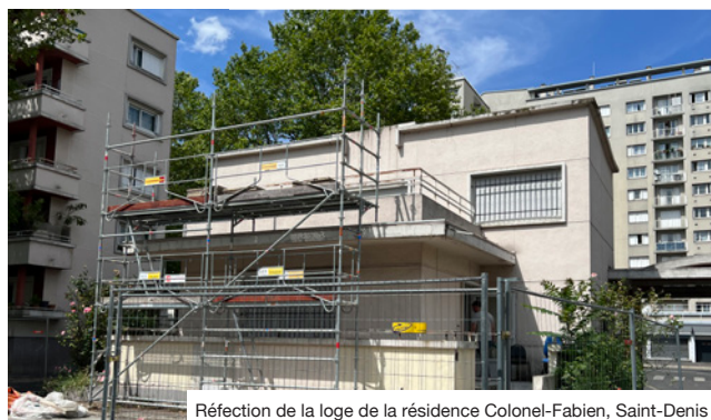
Réfection de la loge de la résidence Colonel-Fabien, Saint-Denis