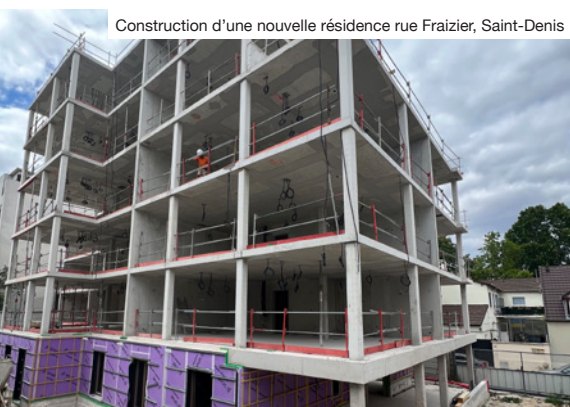
Construction d'une nouvelle résidence rue Fraizier, Saint-Denis